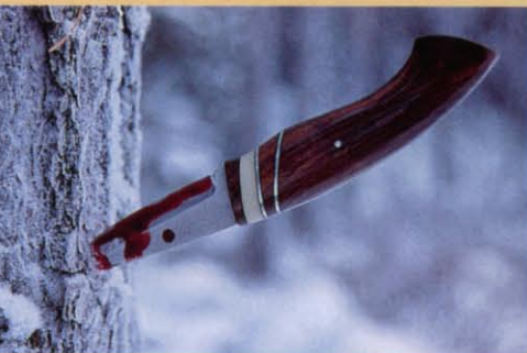
Blod droppar i snön såsom det alltid har gjort.

På något sätt får jag tag på linan och hinner känna ett par rejäla knyckar innan den går loss. Jag vet att en öring aldrig hugger två gånger, men slänger ner mormyskan i hålet igen. På andra rycket sitter den. Det är inte mer än en meter djupt och på den lilla vägen upp till isen hinner han rycka och slita och fara runt så det är som att... innan den glider upp på snön i hela sin mörka