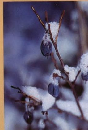
Den enda färgklicken i det bleka vinterljuset är odonen som sitter kvar på riset i strandkanten.